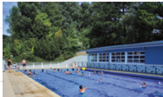
Piscine communautaire Falaises du Talou

445, rue Turoid 76630 Envermeu ☎ 02 35 85 72 87 🌐 www.falaisesdutalou.fr Bassin de 25 mètres extérieur ouvert en saison estivale juillet et août, du lundi au dimanche matin. Cours de natation enfants et aquagym.