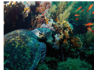
Séjour plongée en Mer Rouge

Des plongées sur épaves sont organisées en fonction des conditions météorologiques